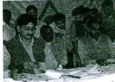
कम्प्यूटीकृत ग्रीनकार्डों को निःशुल्क वितरित करते संस्था के पदाधिकारी

जाता है। उन्होंने भवन स्वामियों को भी सलाह दी कि अपना मकान किराये पर देने के पूर्व सम्बन्धित व्यक्ति के बारे में भली भांति जान लें कहीं वह अपराधी या आतंकवादी तो नहीं है। उन्होंने कहा कि अपने घरों में नौकरों के बारे में एवं उनकी गतिविधियों में भी नजर अवश्य