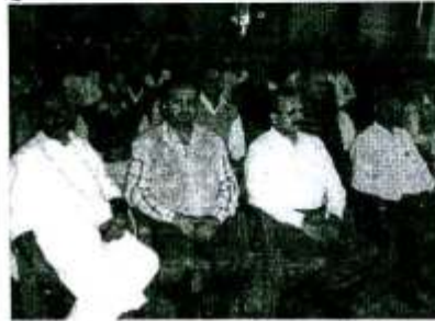
समापन समारोह में मौजूद नागरिकगण