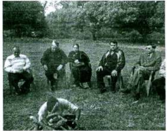
गोष्ठी में भाग लेते प्रतिभागी

किसानों को कराने के लिए युद्ध स्तर पर प्रयास करने होंगे। उन्होंने क्लब द्वारा आगामी माह में आयोजित होने वाले कार्यक्रमों की जनचकारा दी। एस्कॉट हार्ट इंस्टीट्यूट के सहयोग से हार्ट कैम्प, जिलाधिकारी नैनीताल से विकलांग शिविर, जिला स्वास्थ्य अधिकारी से नेत्र शिविर हेतु आवेदन