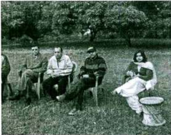
गोष्ठी में भाग लेते प्रतिभागी