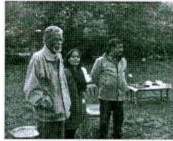
गोष्ठी में भाग लेते प्रतिभागी

तक नहीं पहुंचा पा रहे हैं, इसके लिए प्रदेश तथा के... सरकार को